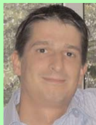
Graphik & Design Tobias Duhm