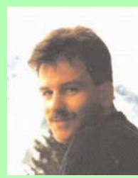
AK Internet Wolfgang Droescher