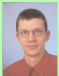
Redaktion Jörn Kindereit